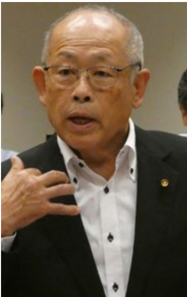
令和7年9月定例会 所感

9月議会では、令和6年度決算の発表があり、 その内容は厳しい状況です。 原因は、基金を82億8,300百万円（13億5,300百万円取崩）とし、一方、地方債（借入金）343億1,400百万円（13億8,900百万円繰上げ償還）となったことです。更に、令和7年2月の中期財政計画において、令和10年度に基金残高を32億円、地方債残高を303億円にするとしたことで、雲南市が合併時に “財政非常事態宣言” を行った時の状況に近づいています。そこまで基金を減らしているのか、将来が不安です。予算カットや基金の取り崩しを行う前に、市長以下三役の給与・議員報酬の減額や、公共施設建設統廃合や複合化（または有るものを活用）が重要ではないでしょうか。